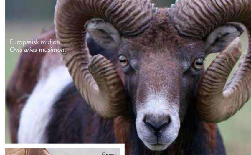
Europæisk muflon Ovis aries musimon.

Hilario Peralta er chef for de otte rangere, der vildtforvalter i Cazorla, og han bekræfter: "De fleste jagtskud er til vildt, der befinder sig 150 til 300 meter fra skytten," og det er der en helt logisk grund til, for, når først man får øje på vildtet, så er det meget, meget vanskeligt at komme uset tættere på en de der 200-300 meter. Den mentale forberedelse skal altså også være indskudt til de lange skudhold. ▶