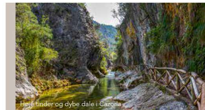
Høje tinder og dybe dale i Cazorla

Sådan bliver det. Mit smil er nok lidt bittert. Jeg gik for vidt i min spareiver og lover mig selv i dette sekund, at næste gang tager jeg min egen riffel med – om det så skal være til Verdens ende. ■