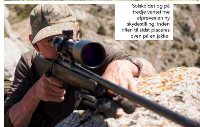
Solskoldet og på tredje ventetime afprøves en ny skydestilling, inden riflen til sidst placeres oven på en jakke.