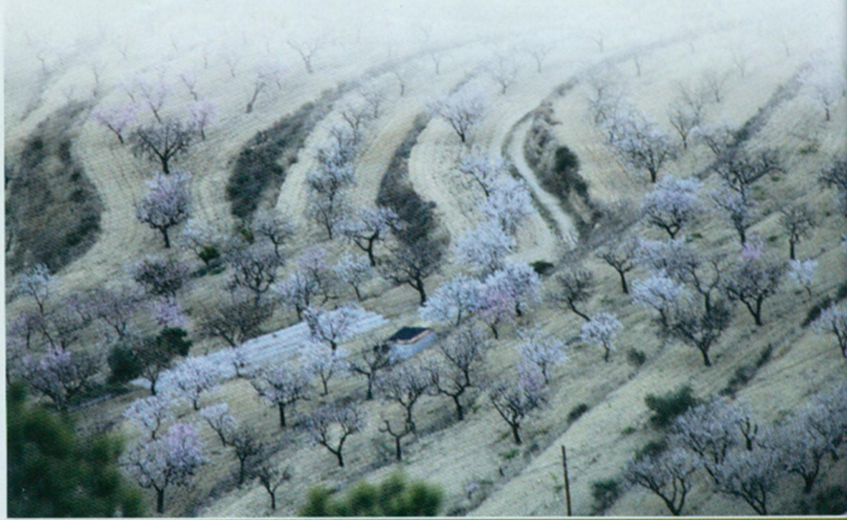
De amandelpantages vormen een onweerstaanbare aantrekkingspool voor de arrui.

De ochtend van de tweede dag vroeg uit de veren. Een bergervaring de Sierra zien en horen ontwakten. Het geluid van de rode patrijzen was nooit lang uit de lucht en gedurende deze snelle vliegers onze weg. Na een uur hielden we een kende rit over de kronkelige bergwegen, kregen wij een vrouwelijke arruis in het vizier op zowat 500 meter. De arruis was klaar, zo laag mogelijk, en gebruikmakend van alle mogelijke dekking, met de wind in het gezicht, bersten wij de dier toe tot een goede 90 meter. Het te strekken dier was gelokt maar door de begroeiing was het niet mogelijk om liggend te schieten. De enige mogelijkheid: rechtstaan en het kruis