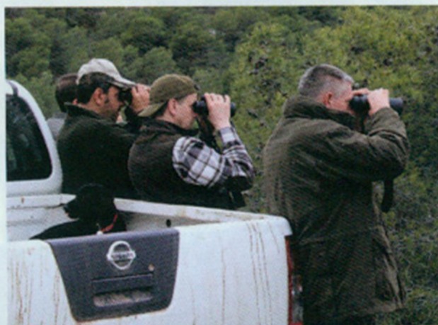
Niet alle neuzen staan altijd in dezelfde richting...