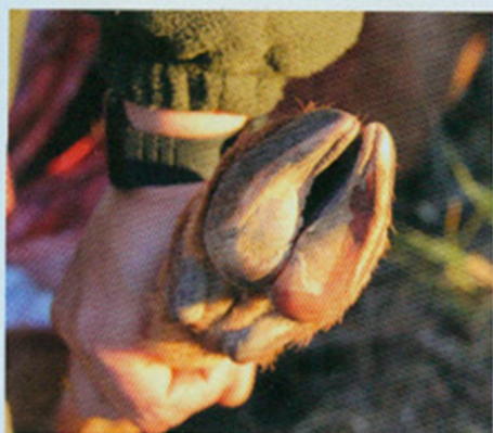
De hoeven van het manenschaap zijn duidelijk gemaakt voor het onherbergzame, rotsachtige gebied.