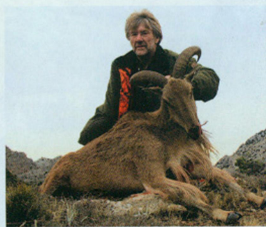
Weer een ervaring om levenslang te blijven koesteren...