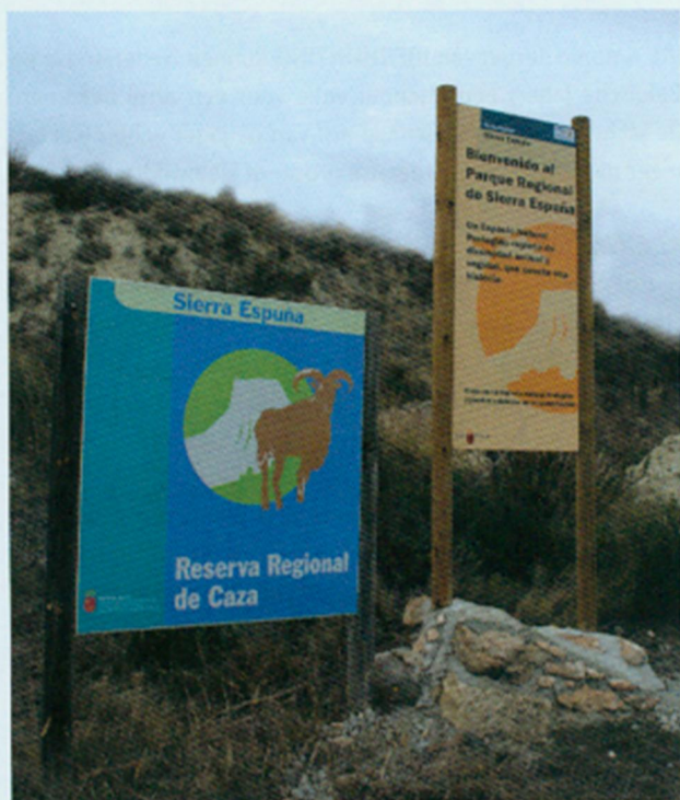
De Sierra Espuña in de regio Murcia, mag zich gelukkig prijzen met een sterke en gezonde populatie manenschapen of arruis.

de arruis. Maar voor ons evenveel te overwinnen obstakels. De geitenpaadjes bleken nauwelijks zichtbaar en lagen vol los gesteente, voor ons een ware overlevingstocht. Als onervaren berglopers hadden we de handen vol met de ogen op het pad te houden en overeind te blijven. Na een eindeloos lijkende,