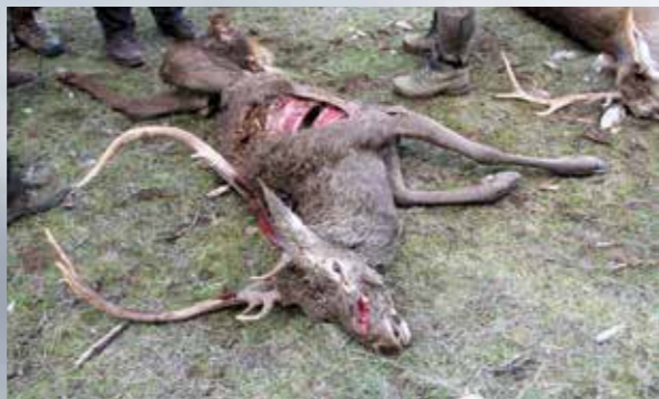
De lucht boven ons trok vol gieren. Die vrijbuiters hadden al lang begrepen dat hier beneden wat te rapen viel. Na de jacht troffen wij één van de gestrekte dieren aan bijna volledig opgegeten door de gieren.