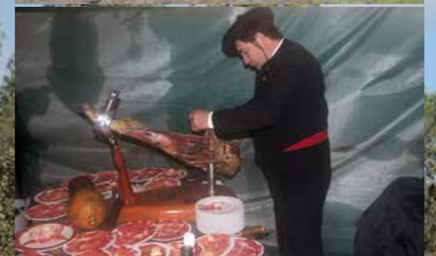
Na afloop van onze tweede montería-dag werden alle genodigden nog verrast met een heerlijke, ter plaatse bereide Spaanse lunch.