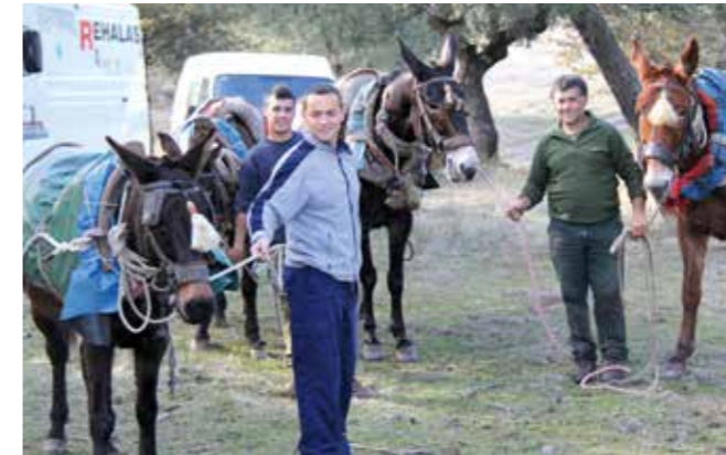
Los arrieros or cargadores - zeg maar picker-ups - (cargar is Spaans voor dragen) zorgen, samen met hun muilezels, voor het ophalen van het gestrekte wild.

daarbij ten grondslag... Die eerste dag werden in totaal 280 schoten afgevuurd wat resulteerde in een behoorlijk tableau met vooral roodwild en ook twaalf everzwijnen.