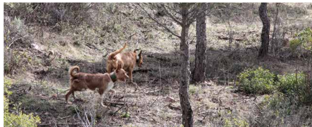
De perreros sturen hun honden ( perros ) vanuit verschillende richtingen het terrein op. Vervolgens brengen de honden het wild voor de geweren van de monteros .

Tot slot plaatsen de guías de rehalas op het terrein. Zij contro-