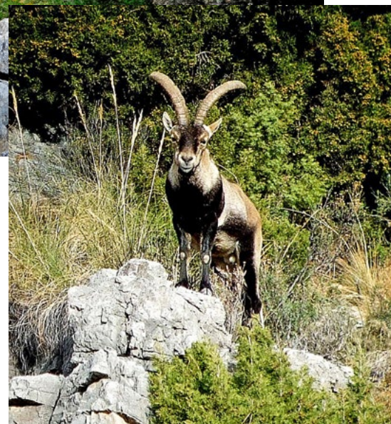
Dieser „Macho“ hat sein Brunftrudel voll im Blick. Sämtliche Nebenbuhler werden sofort von ihm vertrieben

Hören, riechen, gucken...ich bin extrem angespannt. Jede Sekunde kann etwas passie-