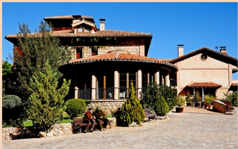
Das Hotel Coto del Valle in Cazorla. Eine perfekte Unterkunft für Jäger und Familie

Weitere Informationen: Antonio und Mercedes Teruel, Iberhunting, Tel. 0034/664283512, E-Mail: iberhunting@iberhunting.com , Homepage: www.iberhunting.com . JE