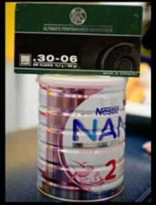
JØGER FELD & VÅPEN, MARS/JUNI 2014

KREATIV LØSNING: Emballasjen for barnemat fra Nestle ble løsningen for en ulykkelig tysk jeger som ble nektet å ha med patronene hjem igjen, uten at de var oppbevart i metallboks!