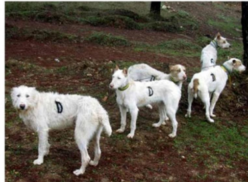
LANGBEINTE HUNDER: I Spania har man ikke påbudt om kortbeinte, drivende hunder til hjortevilt. Tvert i mot var hundene store, sterke og raske.

Men som antatt skjer det desto mer lenger inn og rundt en markert gryte i terrenget, sjelden eller aldri har jeg hørt såpass heftig og intens lidgjøvning i løpet av kort tid. Tydeligvis er det mange drivne drivjaktsskyttere her, fordi smellene fra en og samme skyttere kommer så kjøpt at vedkommende nødvendigvis må være utrustet med en halvautomatisk rifle.