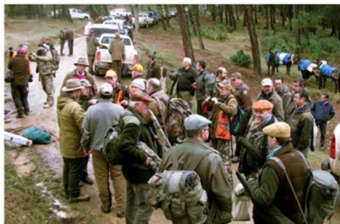
SOSIAL HAPPENING: En spansk Montería er ikke bare jakt, det er like mye en sosial begivenhet hvor man spiser godt, drikker godt (etter jakt!) og ikke minst omgås gode venner!

I hui og hast blir vi kjørt ut til våre respektive poster, som ble fordelt ved en høytlidelig trekning dagen før. Naturlig nok er om mulig forhåpningene enda større, etter å ha vekstet mellom håp og mistro hele formiddagen. For jeg får installert meg på posten, som virker svært lovende med et godt og bredt skuddfelt